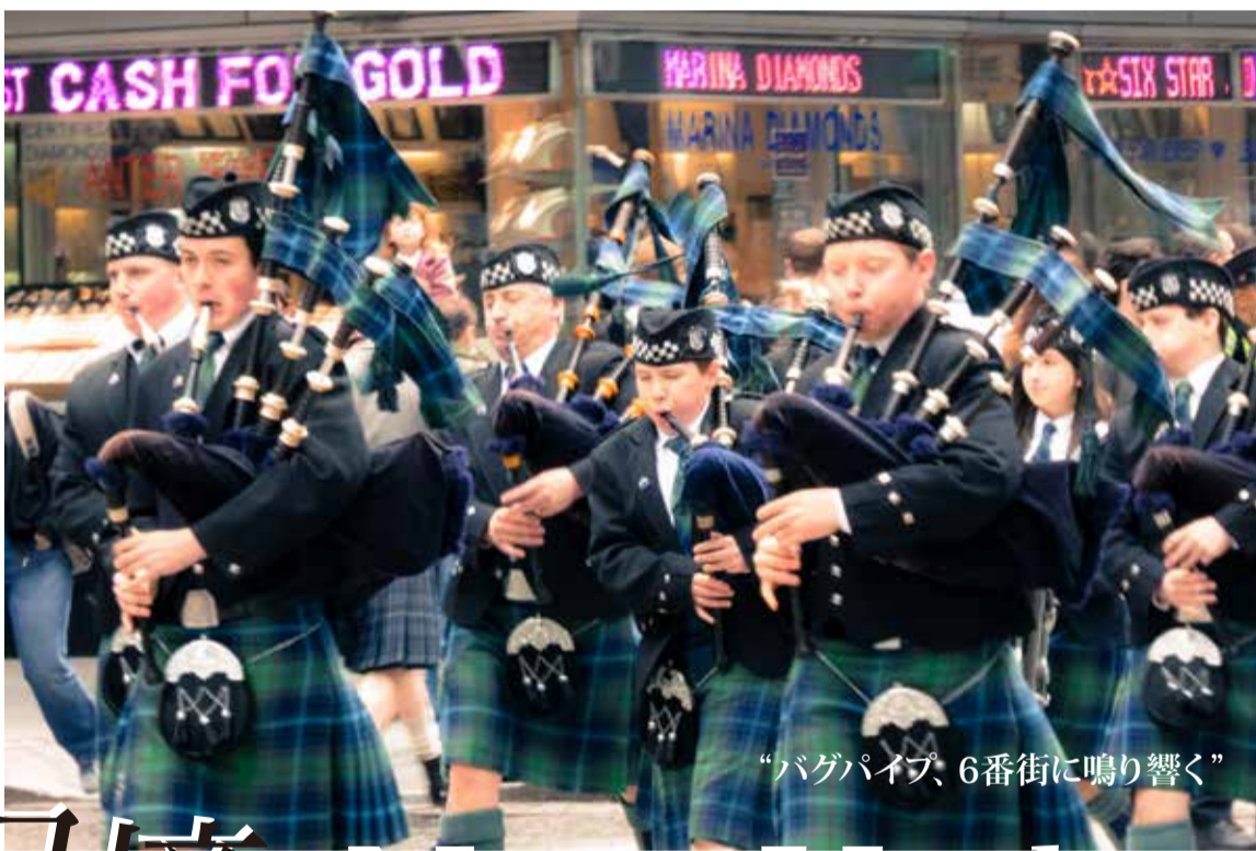
“バグパイプ、6番街に鳴り響く”